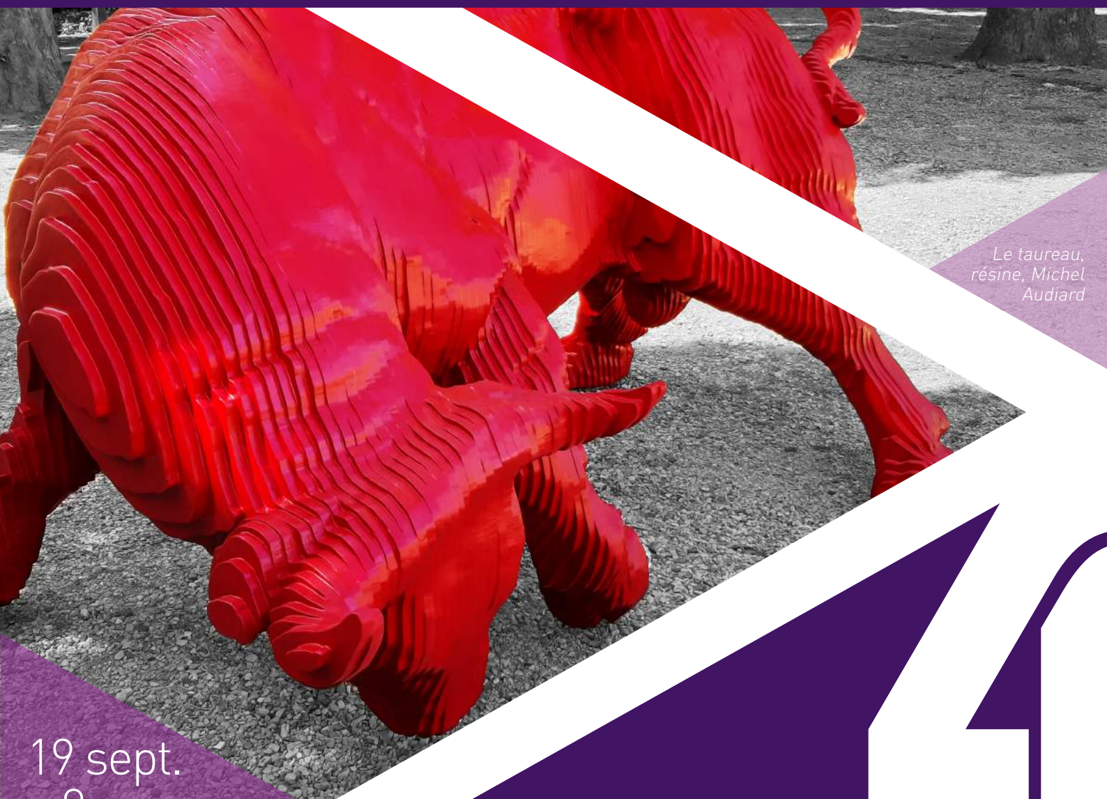
Le taureau, résine, Michel Audiard

À envoyer avant le vendredi 3 avril 2020