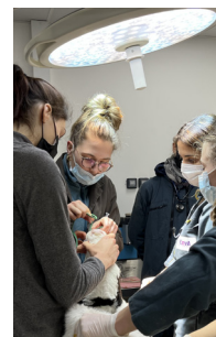
Chats, chiens, nouveaux animaux de compagnie, faune sauvage, chevaux, animaux de ferme

LE SEUL IMPÔT DONT VOUS POUVEZ CHOISIR LE BÉNÉFICIAIRE AVANT LE 31 MAI 2022