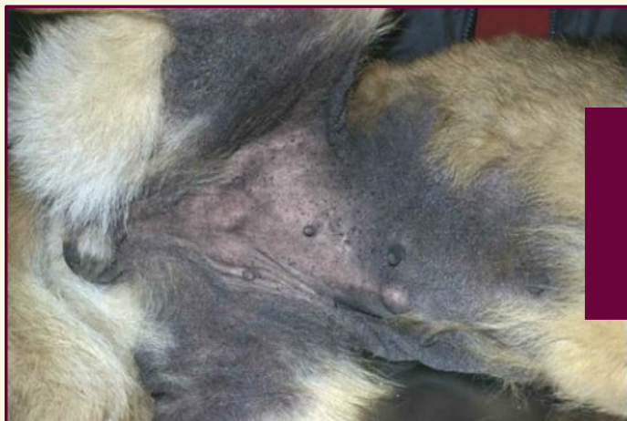
Prolifération bactérienne de surface en région ventrale de l'abdomen avec hyperpigmentation et lichénification