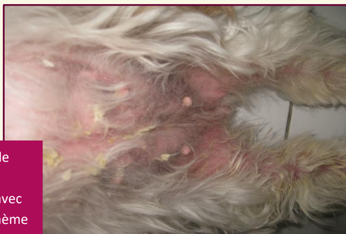
Prolifération bactérienne de surface associée à une prolifération de Malassezia avec présence de squames, d'érythème et de croûtes sur l'abdomen et la face interne des cuisses