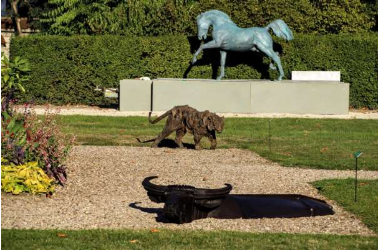
Vue de la Cour d'honneur de l'EnvA lors de l'exposition « Animal en Monument » en 2016