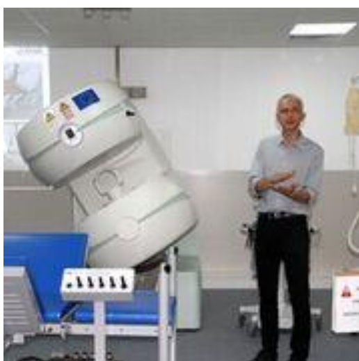
Présentation du matériel par le Pr Fabrice Audigié

Cette extension constitue un événement important pour la Région, la filière équine et pour l'Ecole d'Alfort qui renforce ainsi ses capacités de diagnostic et d'expertise dans ce domaine.