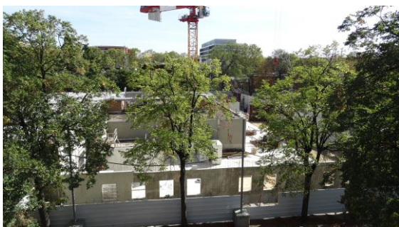
Le bât. Ferrando démolit remplacé par les fondations et le rez-de-chaussée du futur bâtiment Chauveau ; vue prise du bât. Letard le 10 septembre 2018