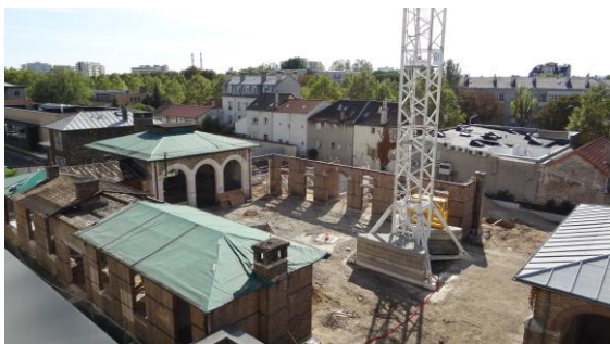
Rénovation et construction du bât. Nocard, vue prise du bâtiment Guérin le 10 septembre 2018