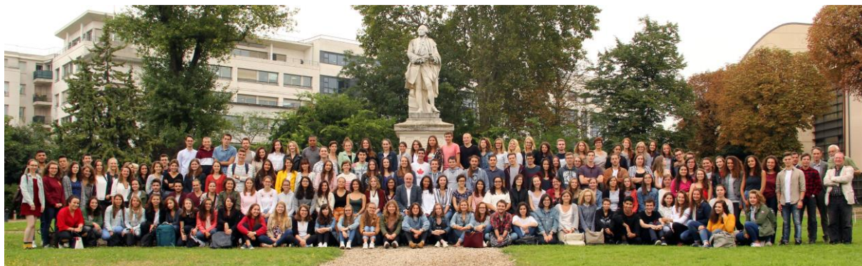
La promotion A 2023 le 6 septembre 2018 à l'EnvA, le directeur assis au milieu et quelques personnels à droite Bourgelat va devoir écartier de plus en plus les bras pour accueillir les nouveaux alforiens !

La présentation s'est terminée en expliquant pourquoi avoir un chien au cours de la scolarité et boire des quantités excessives d'alcool étaient à éviter... Le message passera-t-il mieux de façon humoristique ? Une première pause a permis aux étudiants et aux personnels de se retrouver autour d'un pot d'accueil après avoir effectué la photo de rentrée.