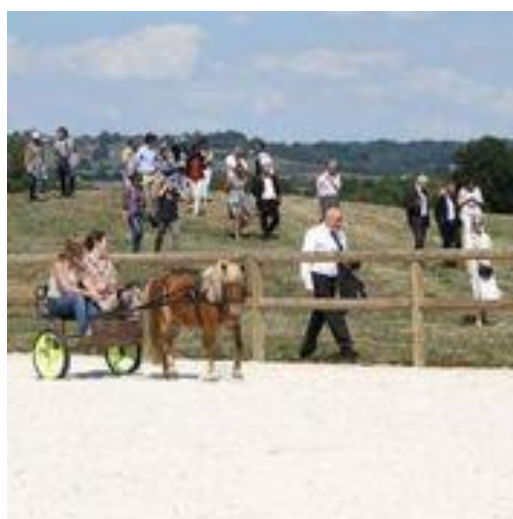
Visite de la piste pour chevaux