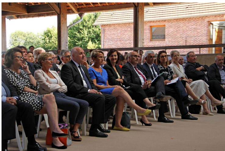
Inauguration de l'extension du CIRALE et des nouveaux équipements : personnalités et public réunis dans la carrière du CIRALE lors des discours.

Toute l'équipe du CIRALE a été heureuse d'accueillir à cette occasion de nombreux membres de l'EnvA et de son Conseil d'Administration qui s'étaient rendus sur le site du CIRALE en amont du protocole officiel. Après un buffet très agréable sous un ciel radieux, l'équipe du CIRALE a présenté le Centre et notamment les nouveaux équipements avec en premier lieu l'unité d'imagerie sectionnelle dotée d'une IRM ouverte inclinable et d'un scanner très grand diamètre permettant l'examen de chevaux sous anesthésie générale et debout tranquilisés ; ces deux équipements sont actuellement uniques en France pour l'imagerie équine. La visite s'est poursuivie sur les deux autres nouveaux équipements phares de l'extension : une piste pour trotteurs et galopeurs et une carrière.