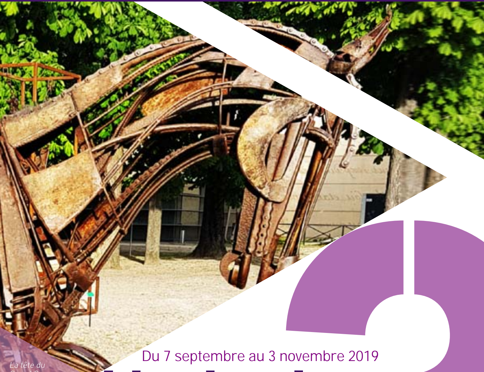
La tête du Grand Ouranos, métal, Christophe Dumont

à envoyer avant le vendredi 19 avril 2019